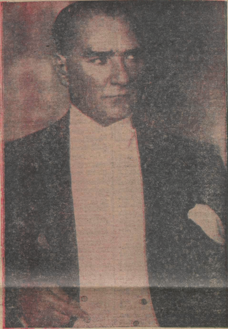
Dehası ve yüksek iradesi ile Türk milletinin, asil tarihine beynelmil yeni bir zafer daha katan Ulu Önder Atatürk

Açık Söz, Heyeti Vekilenin tenzih ettiği üç günlük bir tatilden sonra bugün tekrar vazifesi neşriyesini ifaya başlıyor. Kapalı kaldığımız günler muhterem okuyucularımızın bize karşı olan derin bağlıklarının kuvvetli tezahürüne vesile verdi. Bu münasebelle karierimize şükranlarımızı ve minnettarlık hislerimizi ifadeyi bir borç ve vazife sayıyor, daima onların manevî müzaheretini bekliyoruz.