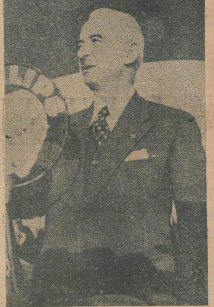
Dün millet karsüsünden Türk milletine Hatay zaferini izah eden Başbakan İsmet İnönü

Onun için Cemiyeti Akvamın bu kadar mühim bir meselede kendi muvaffakiyetini tecessüm ettirerek çıkmış olması ilerideki çalışmaları için ve nihayet beynelmil politika için iyi bir âlâmet telâkki (Devamı 6 da)